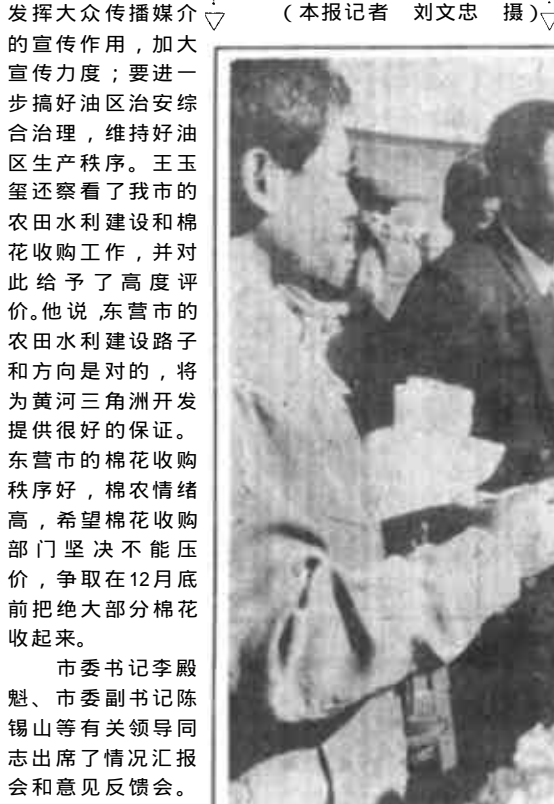
图为副省长王玉玺(右三)带领省“二五”普法检查验收组成员在市领导陪同下深入基层检查工作。